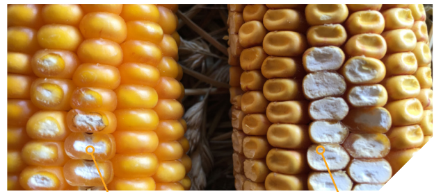
Grain corné denté* vitreux