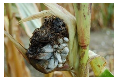
Abb.5: Beulenbrand anstelle eines Maiskolbens

Maisbeulenbrand tritt in frühen Entwicklungsstadien ab dem 4.-5.Blatt als kleine, helle, hintereinander aufgereichte Blasen oder als längere Beule an den Blättern auf. Kleine Beulen können später vertrocknen. Bei stärkerer Ausbildung zerreißt das Blatt. Äußerst selten ist ein sehr früher, starker Befall, bei dem die junge Pflanze abstirbt. Es kann der Stängel, Kolben oder auch die Rispe mit den typischen, silbergrau glänzenden Gallen befallen sein. Diese Gallen reifen aus, platzen und entlassen schwarzes Sporenpulver. Die Gallen können alle Größen bis zu 15 – 30 cm im Durchmesser aufweisen.