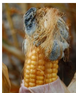
Abb.4: befallene Kolben-spitze

Der Kolben wird häufig nur am oberen Ende befallen. Bei schwerem Befall fehlt der Kolben fast ganz und es wachsen nur Gallen zwischen den Lieschblättern (Abb.5).